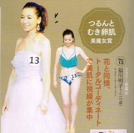
つるんとむき卵肌 美魔女賞

「ファスティングの5kg減りより、般を破って体裁より行動に集中したことが大きかった」。応援者が増えて自信に変わった。自己PRでは安室ちゃんの「Body Feels EXIT」を英語ダンスとともに披露。ドレス ¥55,000(DRESS SHOP TWEED)